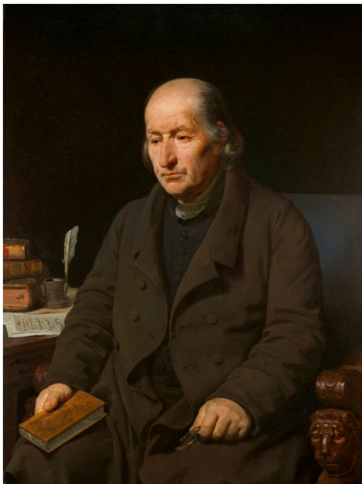
Jean-Baptiste Mauzaisse, Portrait du père de l'artiste, 1827, huile sur toile, Musée d'art et d'histoire de Melun (dépôt du Louvre)