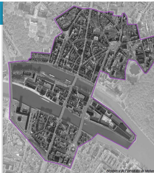
Périmètre de l'OPAH-RU de Melun

PLUS DE 11M€ DE FINANCEMENTS PRÉVUS SUR 5 ANS !!